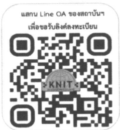
แกลน Line OA ของสถาบันฯ เพื่อขอรับลิงก์ลงทะเบียน

จึงเรียนมาเพื่อโปรดพิจารณาโครงการฯ ดังกล่าว จักขอขอบคุณยิ่ง